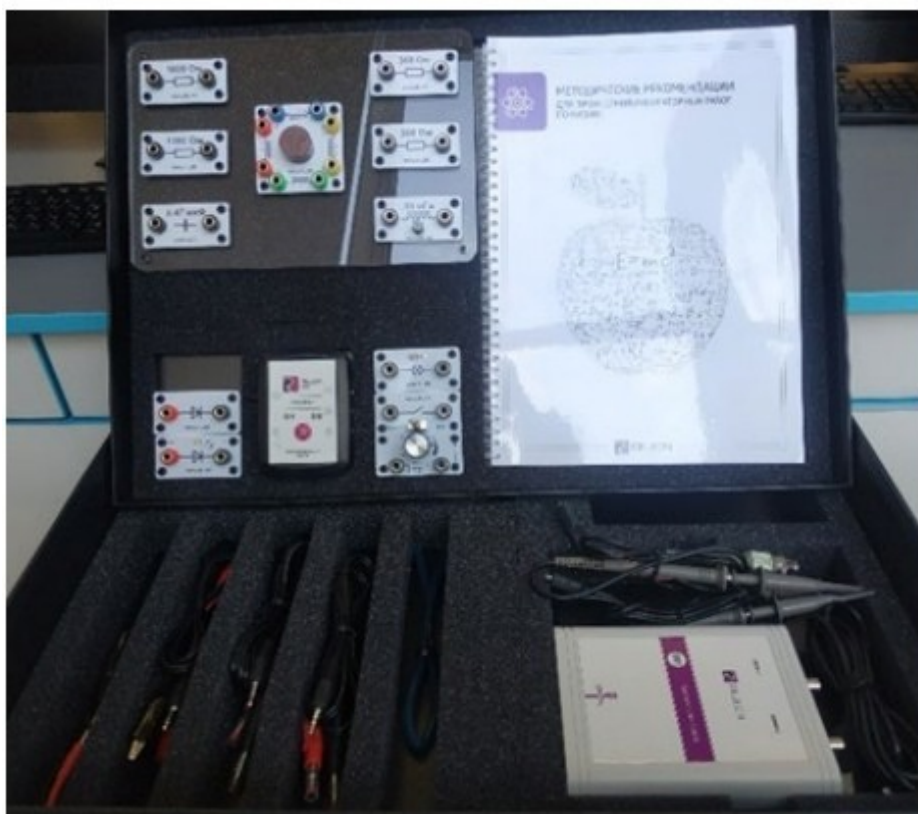
Рис. 1. Цифровая лаборатория по физике

Датчик (рис. 2) производит измерения абсолютного давления. Чувствительный элемент датчика выполнен на базе монолитного кремниевого пьезорезистора с внедрённой тензорезистивной структурой, которая позволяет исключить возможные погрешности и достигнуть необходимой точности измерений. В комплект датчика абсолютного давления входит гибкая герметичная трубка для подключения штуцера датчика к лабораторному оборудованию.