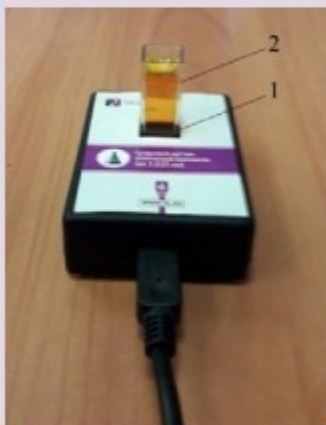
Рис. 1. Датчик оптической плотности: 1 — гнездо для кюветы; 2 — кювета для исследуемого вещества

Датчик температуры платиновый — простой и надёжный датчик, предназначен для измерения температуры в водных растворах и в газовых средах. Имеет различный диапазон измерений от -40 до +180 °С. Технические характеристики датчика указаны в инструкции по эксплуатации.