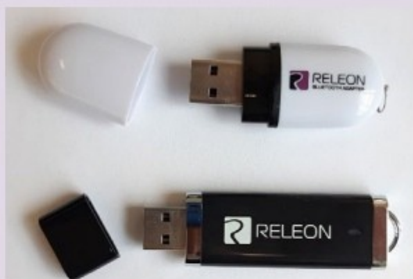
Рис. 13. Общий вид USB-флеш-накопителя (внизу) и Bluetooth-адаптера (вверху) Releon

В комплекте цифровой лаборатории Releon поставляется программное обеспечение Releon Lite на USB-флеш-накопителе, а также Bluetooth-адаптер для связи регистратора данных с беспроводными датчиками (рис. 13).