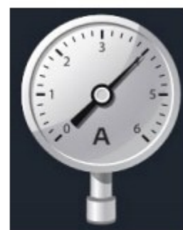
Рис. 2. Датчик абсолютного давления